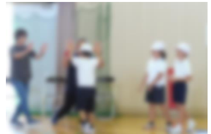
大健闘！ 2年生チーム

8月28日の登校日に、昨年に引き続き「ポッチャ島中選手権」を行いました。今年は、地域・保護者からも参加を募り、パワーアップした選手権になりました。地域と児童の混合チームでは、互いに声をかけ合ったり、好プレイの時はハイタッチをしあったり、ほほえましい交流がみられました。