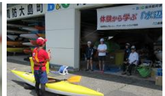
7/31 6年博物館出前授業勾玉づくり・5年B&Gにてカヌー教室